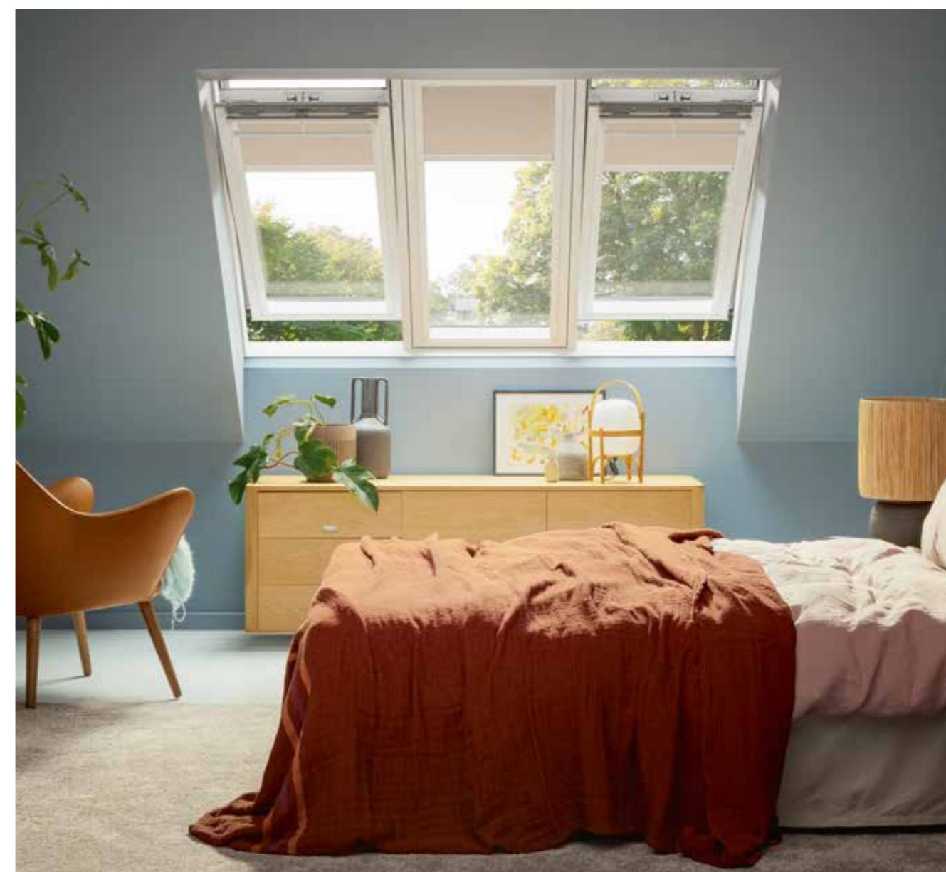
Dakvensters voor hellend dak