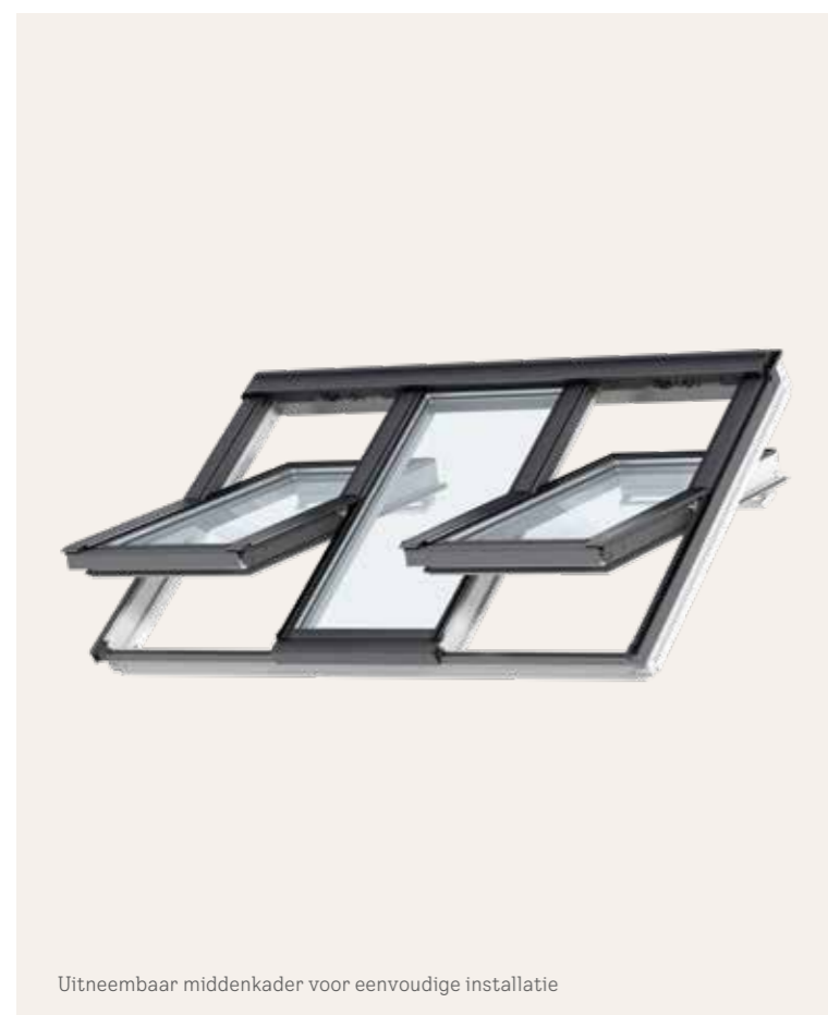
Uitneembaar middenkader voor eenvoudige installatie