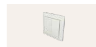
KFK 200 WW