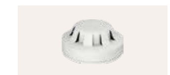
KFA 100 WW