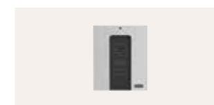
KFC 310 EU

Venster te combineren met een rookventilatiecentrale en een rookventilatieknop met prioriteitschakelaar voor de brandweer of een rookventilatieknop (met een sticker die voldoet aan de norm)