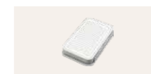
KLA 200 WW