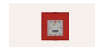
KFK 311 EU