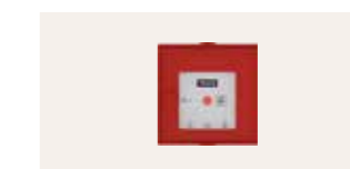
KFK 301 EU